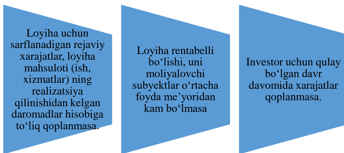
1-rasm. Investitsion loyihalarni ilmiy asoslarda qabul qilish shartlari.

Aynan investitsion loyihalarning ilmiy asoslariga ko‘ra, loyihaga tegishli bo‘lgan barcha bo‘limlarning nafililigi yuqori bo‘lsada, quyidagi shartlar bajarilmasa loyihani amalga oshirish uchun qabul qilinmasligi zarur: